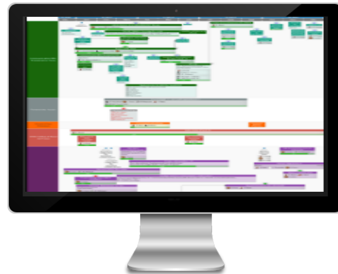
Pilotage stratégique et opérationnel

«Je pense que l'outil est déjà assez évolué en termes de fonctionnalités.», nous livre également le Responsable Communication Corporate du groupe.